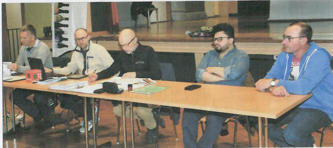
Le comité planche sur les stratégies à prendre.