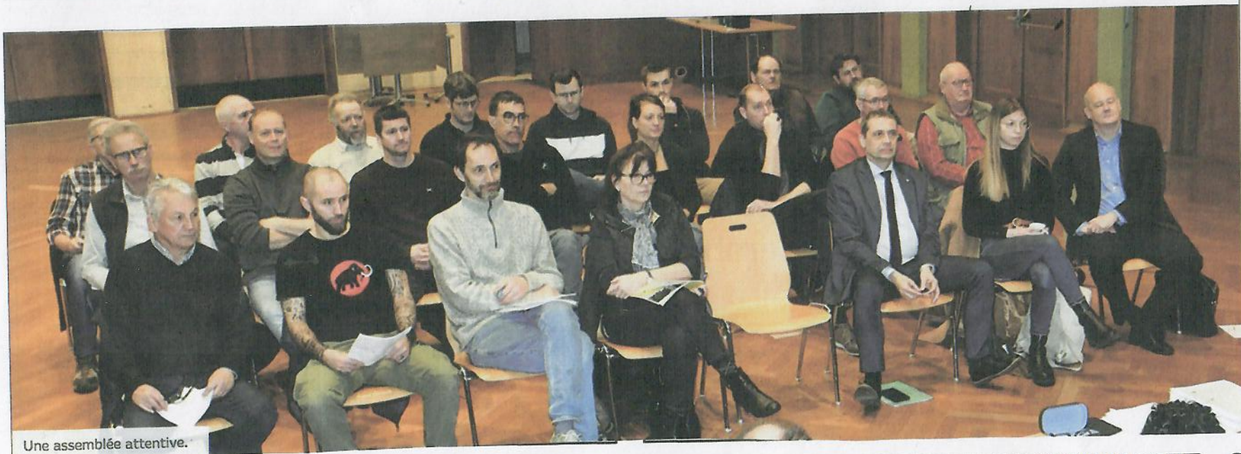
Une assemblée attentive.

Une chose est sûre, le marché du vin n'est pas apathique et les vignerons sont prêts à se retrouver les manches lors d'événements promotionnels tels que les journées caves ouvertes, le semi-marathon des Côtes de l'Orbe, la balade gourmande d'Arnex, le salon annuel des Côtes de l'Orbe à Daillens ou encore le marché de Noël d'Yverdon, pour n'en citer que quelques-uns.