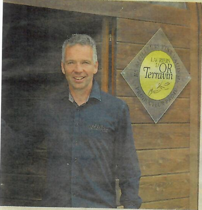
...uthey, vigneron-encaveur à Arnex-sur Orbe (vins des Côtes de l'Orbe).