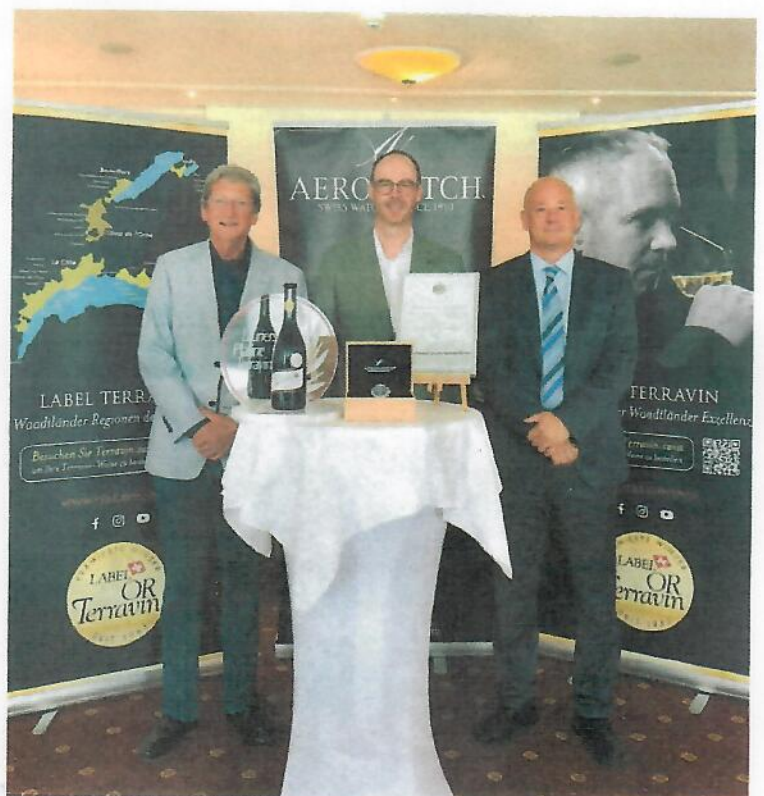
Le prix spécial offert par Aerowatch