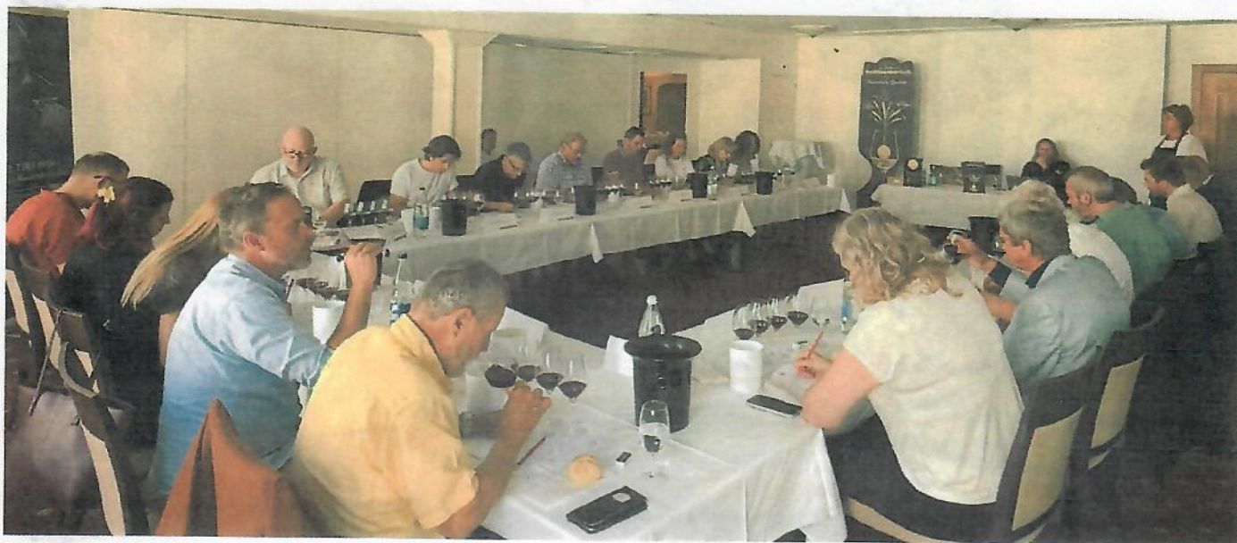
Un jury de 21 journalistes et professionnels a élu: Château de Valeyres, Confidentiel Merlot, Côtes-de-l'Orbe AOC, 2023 selon un mode d'élimination progressive et à l'aveugle.